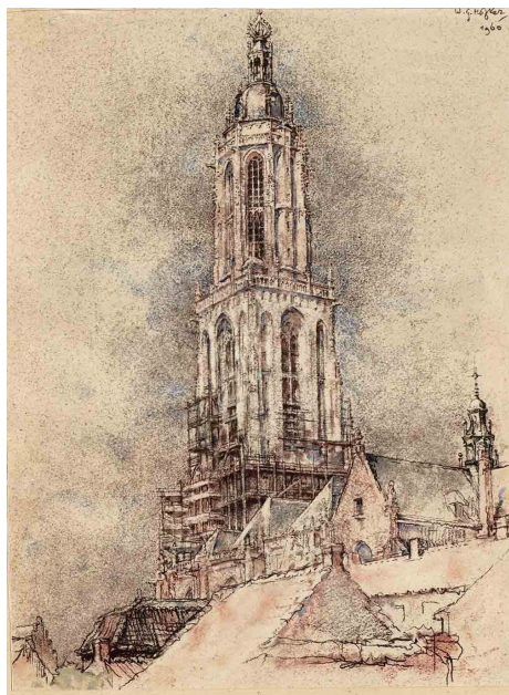
Tekening Willem Hofker 1960