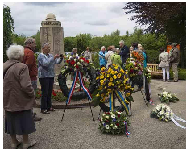
foto's van de Herdenking in 2018